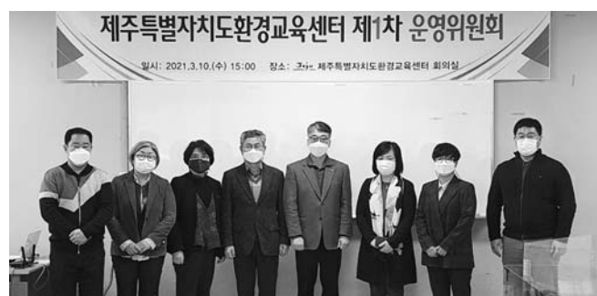
계자, 환경교육 전문가 등 10명으로 구성됐으며 위촉기간은 2023년까지이다.