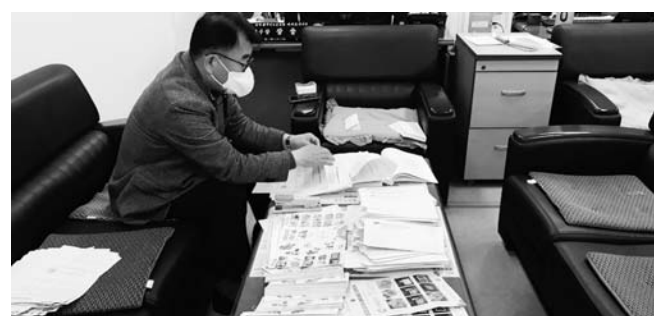
수성이 널리 알려질 수 있도록 지부연계망을 통해 추가적으로 홍보할 계획"이라고 말했다.