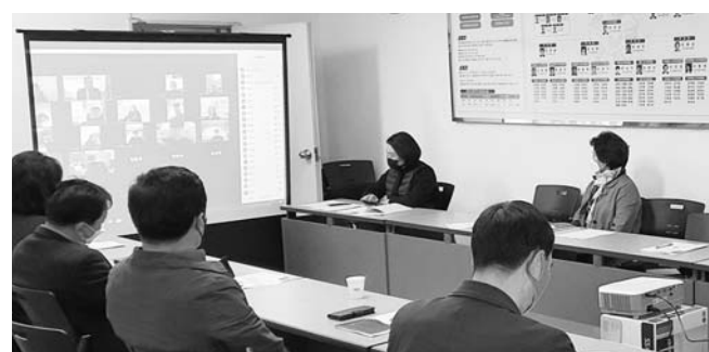
군 협의회와의 비대면 워크숍 계획 등에 대해서도 논의가 진행됐다.