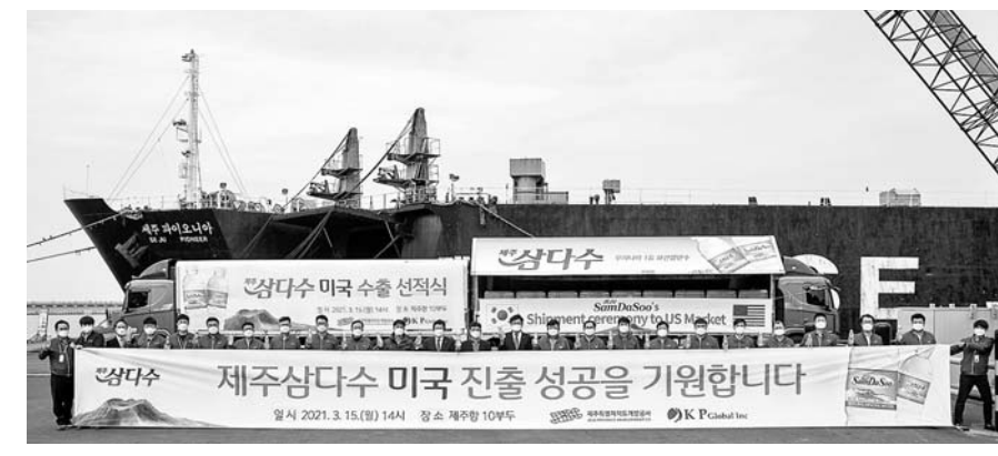
지난 15일 제주항에서 제주개발공사 관계자들이 참석한 가운데 제주삼다수 미국 시장 수출을 기념하는 선적식이 열렸다.

가 임명을 강행할 수 있다. 이런 문제로 인사청문회 무용론이 불거지자 도의회는 인사청문 대상에 행정시장과 정무부지사 등을 포함하는 대안을 제시했지만, 제주도는 추후 논의하자며 입장을 유보했다. 도 관계자는 “(임명적 기관장의 자질과 능력) 충분히 검증해야 한다는 점에서 인사청문 대상을 확대하는 것은 바람직하다고 생각한다”면서도 “그러나 현재 국회에서도 동의의 대상을 헌법재판소장과 감사원장으로 제한한 점, 지자체장과 정책 기조를 맞춰야 할 정무부지사 등까지 의회 동의를 받는 것은 과도한 인사권 침해 문제를 낳을 소지가 있는 점을 고려하면 신중을 기해야 한다”고 전했다. 교육위원의 본회의 의결권 제한과 의원 정수에서 제외하는 방안도 난항이 예상된다. 도교육청은 조만간 이런 의회의 구상에 대한 반대 의견을 낼 예정이다. 도교육청 관계자는 “도민들이 직접 뽑은 교육위원의 의결권을 제한하고, 정수에서 제외하는 것은 교육 자치 훼손 논란을 부를 수 있다”며 “부동의 의견을 제출하기로 했다”고 말했다. 도의회 구상과 일치하거나 비슷한 의견도 있었다. 도는 행정시장 직선제에 대해 의회처럼 도입 의견을 냈다. 또 아직 의견 제출 전이지만 영리병원에 대해선 이는 외국인만 치료하는 외국인 전용 의료기관으로 제주특별법에 명확한 법적 근거를 두는 쪽으로 입장을 정리한 것으로 전해졌다. 이상민기자 hasm@ihalla.com