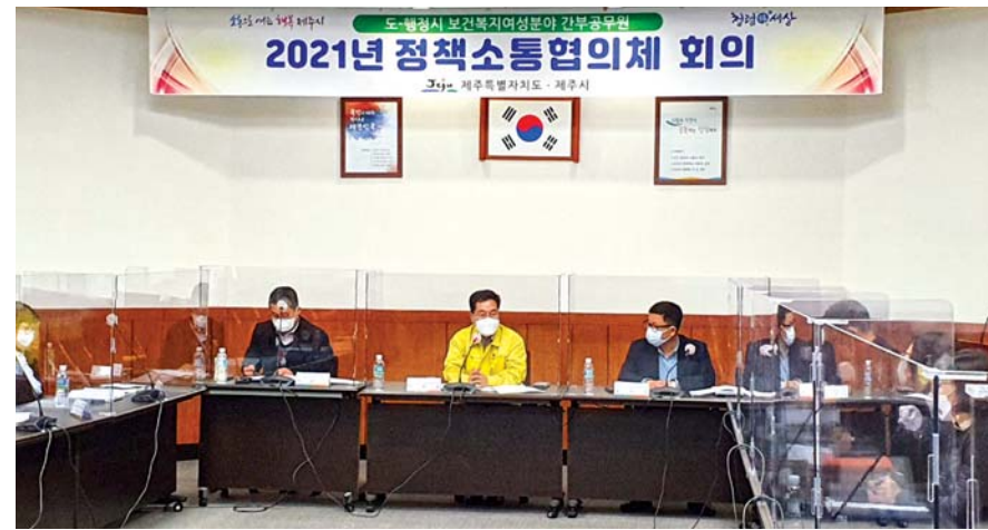
제주특별자치도는 30일 제주시에 '보건복지여성분야 간부공무원 2021 정책소통협의체 회의'를 열고 도민 체감형 정책 발굴을 위해 협력해 나가기로 했다.

건소장, 서귀포보건소장 등 약 20여 명이 참석한다. 이 자리에선 올해 주요사업 및 현안사항 논의, 도-행정시 보건복지여성분야 다양한 의견 수렴 등이 이뤄진다. 앞서 제주도는 지난해 9월 도-행정시 보건복지여성분야 간부공무원 정책소통협의체를 구성해 1차 회의를 개최한 바 있다. 임태봉 도 보건복지여성국장은 “코로나19 장기화로 감염증 취약계층 등 도민들이 체감할 수 있는 보건복지여성정책이 필요하다”며 “정책소통협의체 회의에서 제시된 정책제