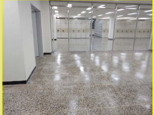
제주대 중앙도서관 도끼다시바닥