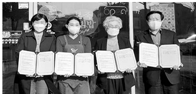
단체와 협력해 이웃을 살피는 인사캠페인 등을 실시하며 따뜻한 온기가 넘치는 화북동 구현에 앞장설 계획이다.