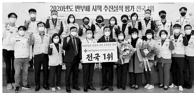
임직원 및 봉사원의 협조로 얻은 결실"이라며 "반부패시책 확대를 도민의 신뢰를 높여나가겠다"고 말했다.