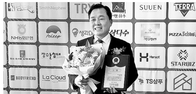
서치 조사기관을 통해 명품브랜드 대상 심사선정위원회가 평가했다.

이날 시상상은 브랜드별 인지도, 대표성, 만족성 등에 대해 성·지역·연령·Quota에 의한 비례할당추출로 제주도를 제외한 만 20~59세 남·여를 대상으로 온라인 한국리