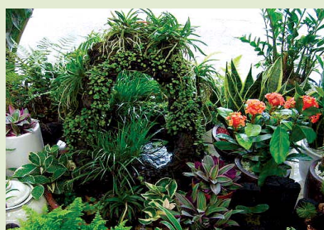
모든정원, 실내조경, 가정, 별장, 빌딩조경, 연못, 인공폭포, 잔디, 조경수 판매

꽃보라화원 ☎ 746-0014, H.P 010-3693-5563 (제주시거리 위 국민은행 신제주지점 맞은편 골목) 농 장 제주시 용담2동 721번지