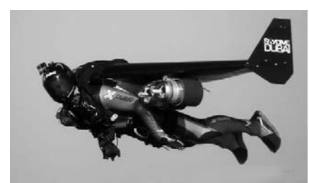
'두바이 제트맨' 뱅스 르페.

영화 속 슈퍼히어로처럼 특수 제작한 장비(윈수트)를 착용하고 하늘을 누비던 프랑스 스텐트맨 뱅스 르페(36)는 낙하산이 퍼지지 않아 사망한 것으로 드러났다.