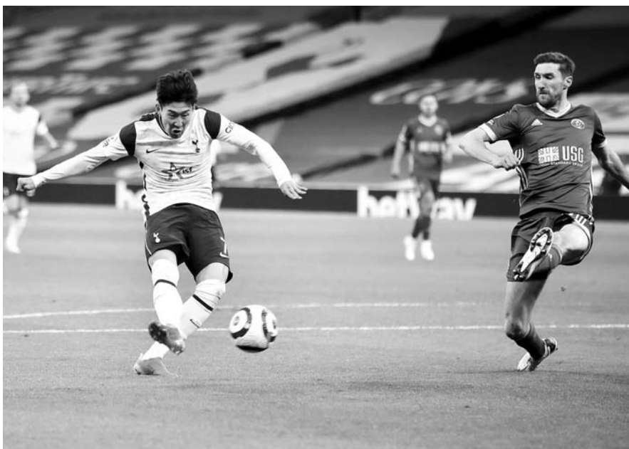
3일(한국시간) EPL 34R 세필드전에서 득점을 성공시키는 손흥민.

토트넘에서 10골-10도움을 올린 선수는 위르겐 클린스만(20골 10도움·1994-1995시즌), 예마누엘 아데바오르(17골 11도움·2011-2012시즌), 크리스티안 에릭센(10골 10도움·2017-2018시즌)과 지난 시즌의 손흥민(11골 10도움), 올 시즌의 해리 케인(21골 13도움)뿐이다. 토트넘은 리그 최하위 팀인 세필드를 상대로 손흥민과 개러스 베일, 케인, 델리알리의 공격 ‘4각 편대’를 가동했다. 베일이 토트넘 이적 뒤 첫 해트트릭을 작성하며 토트넘을 대승으로 이끌었다. 베일은 전반 36분 세르주 오리에가 후방에서 띄워준 침투 패스를 골 지역 오른쪽에서 방향만 바꾸는 슈팅으로 마무리해 선제골을 뽑았다. 후반 16분에는 역습 상황에서 베일이 단독 드리블 뒤 골키퍼와 일대일 상황에서 침착하게 왼발로 슈팅해 2-0을 만들었다.