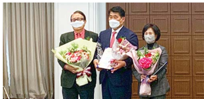
친환경 신미생물 공법을 도입해 스마트 농업생산기술을 발전시켜 혁신성장을 거듭하는 친환경 바이오기업이다.

장영실국제과학문화상은 조선의 과학자이자 발명가인 장영실의 과학 정신과 발명기술의 맥을 계승하기 위해 매년 혁신적인 성과를 거둔 사람이나 기업에 주어지는 상이다. GSL바이오는 친환경적인 복합유산균을 독자 개발하고