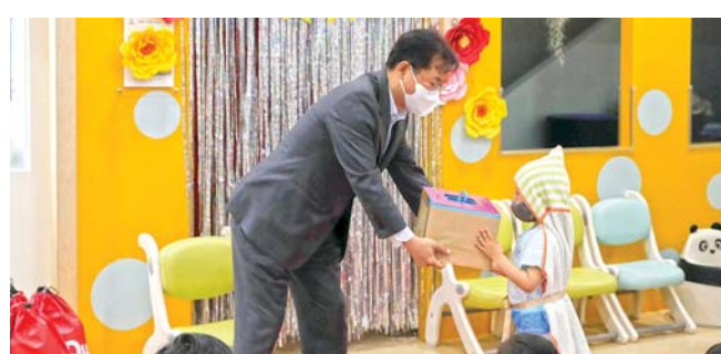
등 다양한 사회공헌활동으로 사회적가치를 실현해 나가고 있다.

한편 공단은 서귀포 혁신도시에 자리한 공공기관으로 5월 가정의 달을 맞아 아동학대 후유증 회복 지원을 위한 성금 기탁, 사랑의 밥차 운영, 교통안전캠페인 활동