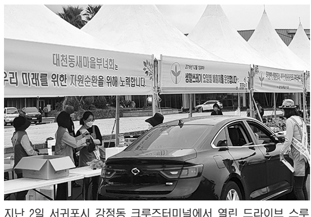
지난 2일 서귀포시 강정동 크루즈터미널에서 열린 드라이브 스루 형태의 알뜰 나눔장터.

이날 방문객들이 구입한 물건을 개별 장바구니에 담아 일회용 비닐봉투 사용을 최소화했으며 ‘생활폐기물 분리배출을 생활화합시다’라는 주제로 가연성