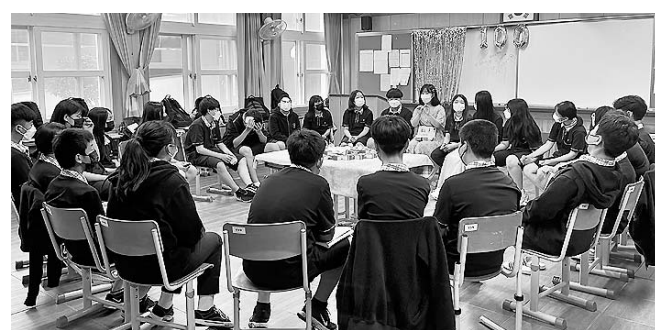
눔 독서토론 프로그램, 학교생활만족도 조사 등이 진행될 예정이다.