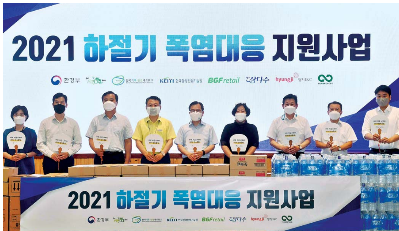
15일 경기 구리시청에서 폭염 취약계층을 위한 폭염 대응 기부물품을 전달한 뒤 참석자들이 기념촬영을 하고 있다.

기상청이 지난 2월 발표한 올 여름 기후전망에 따르면, 금년 여름 기온은 평년(23.3~23.9℃)보다 높을 것으로 예측되는 상황이다. 이에 따라 기후변화로 인한 폭염 등 극한 기상의 빈도, 강도가 심해져 상대적으로 적응능력이 떨어지는 사회, 경제적 취약계층이 증가하고 있는 상황이다.