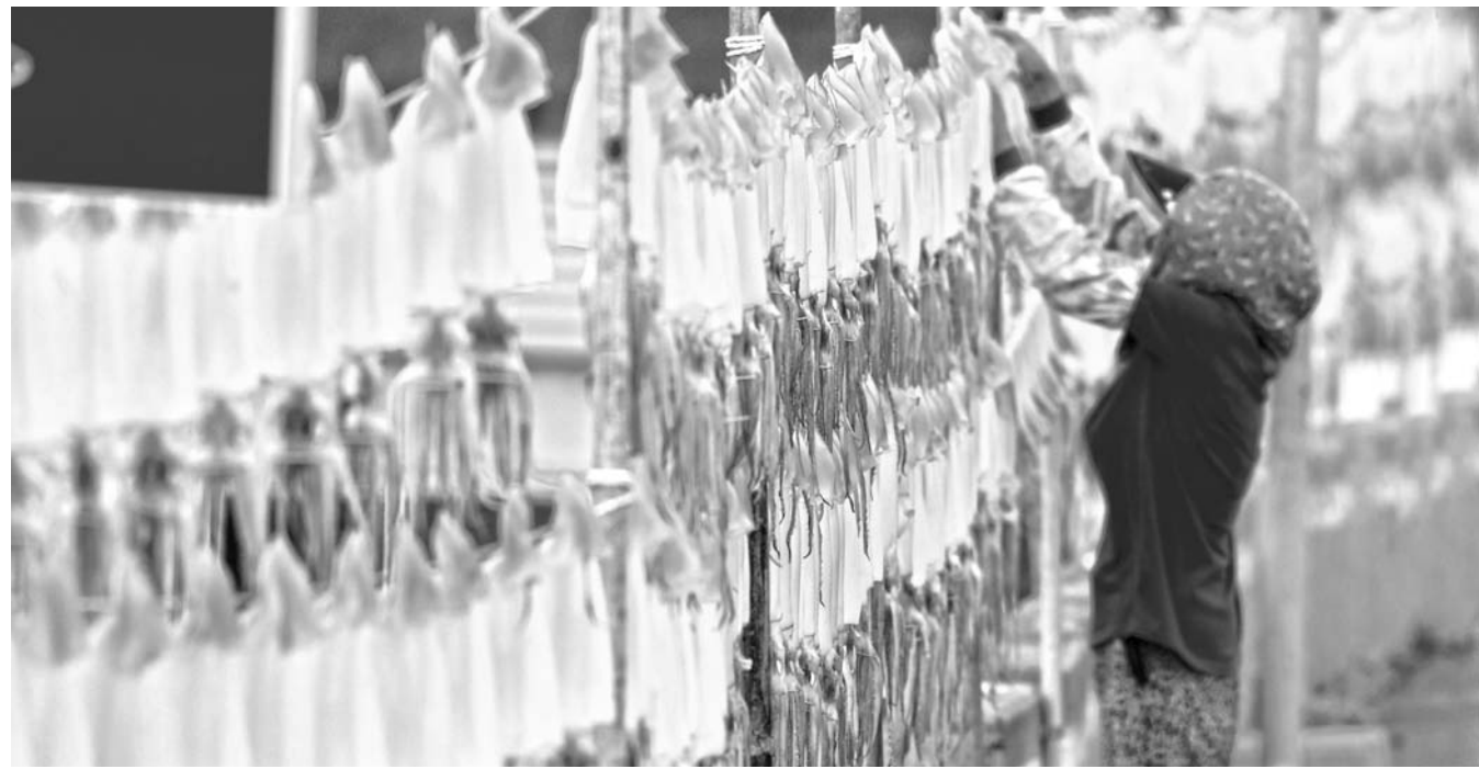
메이드 인 제주 바람 맑은 날씨를 보인 27일 제주도 환경청 고산포구에서 한 어머니 오징어말리기 작업을 하고 있다. 강희만기자