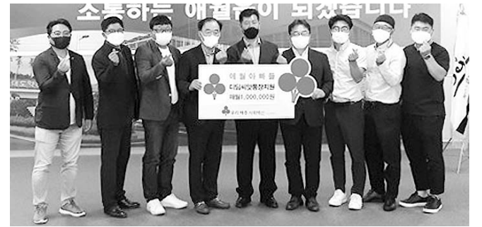
탁받은 후원금을 통해 가정형편이 어려운 디딤씨앗통장 가입 아동을 대상으로 월 5만원 내외의 금액을 지원한다.

디딤씨앗통장은 만 12~17세의 저소득층 아동 대상으로 월 최대 5만원의 1:1 매칭 지원금을 지급해 아동이 만 18세 이후 사회진출 시 학자금·취업·창업·주거 마련에 초기비용을 위한 자산형성을 지원하는 사업이다. 기