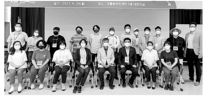
한 양질의 관광 일자리 창출에 시민의 역할을 확대하기 위해 맞춤형 방식으로 퍼실리테이터 양성과정을 운영, 지역 관광산업 중심의 미래형 관광인재를 배출할 계획이다.

특히 이번 교육에서는 민관 협치를 도모하고 최근 사회적 문제로 떠오르고 있는 지역 내 갈등 문제 해결과 다양