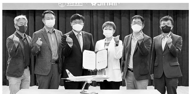
제주관광공사 면세점은 제주발 국내선 항공 및 선박 이용고객이라면 누구나 이용 가능하다.