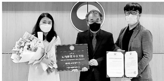
인증을 받았다. 선정된 기업엔 3년간 기업신용평가 가산점 부여, 정부의 행정 지원 등 여러 혜택이 주어진다.