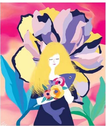
월정아트센터 우주의 '난 나를 사랑해 1'.