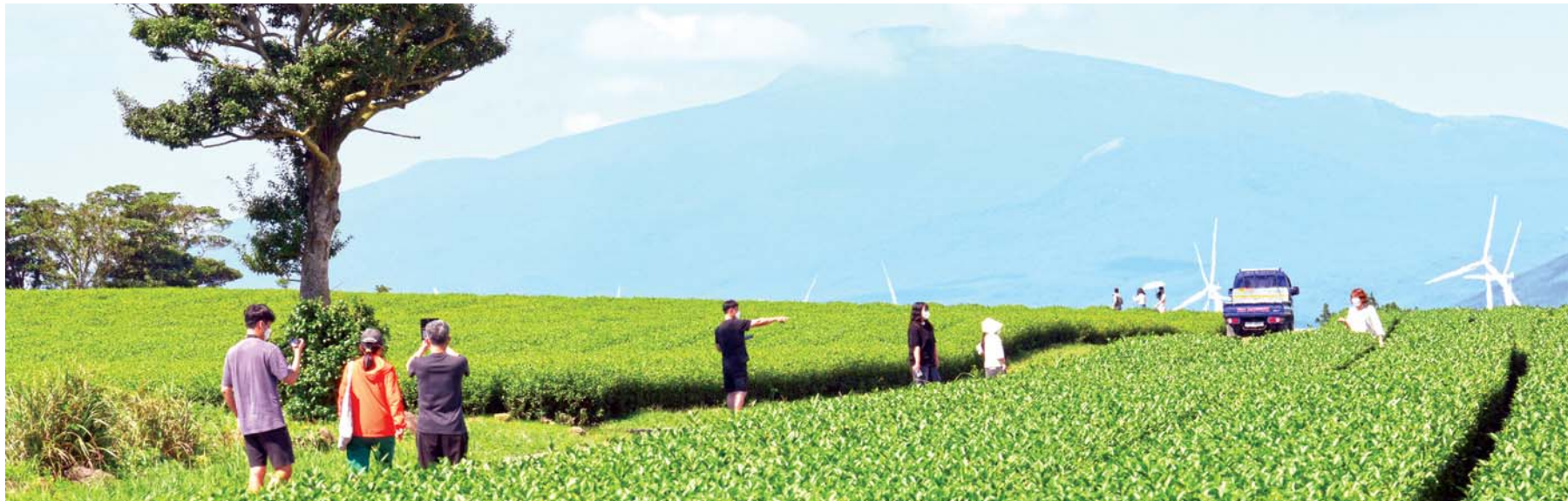
한라산과 녹차밭 9일 서귀포시 표선면 성읍리 한 녹차밭을 찾는 관광객들이 한라산과 어우러진 주변 절경을 만끽하고 있다. 이상국기자

은 대정초등학교 선형 확진자와 동선이 겹치면서 감염된 것으로 추정하고 있다. 또 BHA 국제학교 6학년 학생 1명이 확진 판정을 받았다. 다만 이 확진 사례는 대정초등학교 집단감염과는 연관이 없는 개별 사례라고 도방역당국은 설명했다. 제주도는 대정중학교 학생 및 교직원 150여명, BHA 국제학교 학생 및 교직원 80여명 등 230여명을 대상으로 코로나 진단검사를 진행 중이다. 검사 결과는 10일 오후부터 순차적으로 확인된다. 강다혜기자