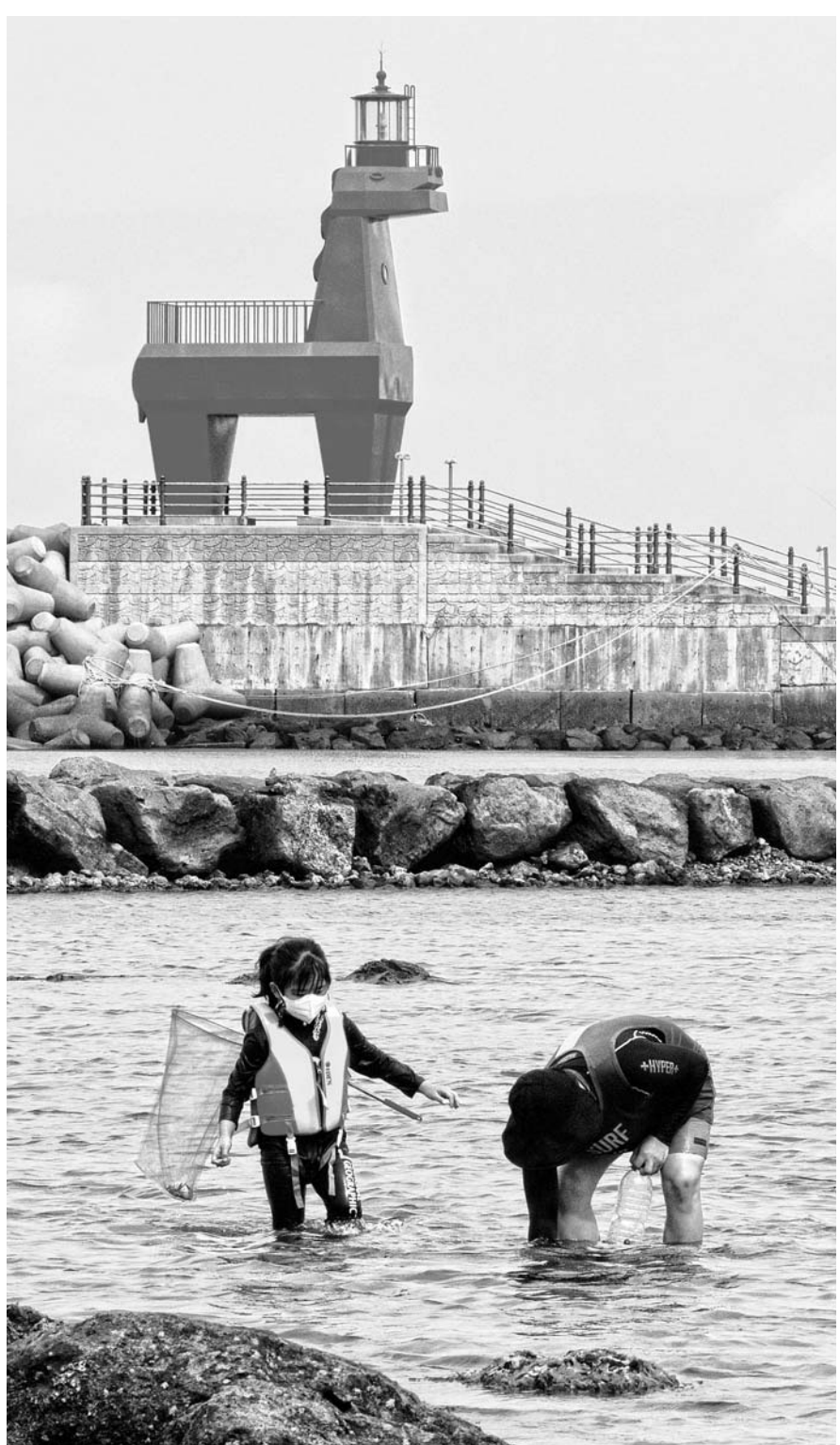
원당서 조개줍기 12일 제주시 이호태우해수욕장을 찾은 시민이 자녀와 함께 원당에서 조개를 주우며 즐거운 시간을 보내고 있다.

경정은 조직폭력배간 린치 사건 첩보를 입수, B씨에게 사실을 확인하기 위해 면회를 진행한 것"이라며 "특히 당시 B씨에 대한 구속영장 집행사가 진행 중이라 굳이 B씨를 급하게 만날 이유도 없었다"고 주장했다. 최후변론에 나선 A경정은 "법정에 섰다는 사실에 참담함을 느낀다. 2년여 남은 경찰 생활을 명예롭게 마무리할 수 있도록 해달라"고 호소했다. 류지원 판사는 오는 10월 15일 선고공판을 진행할 예정이다. 한편 지난해 8월 SBS '그것이 알고 싶다'에서는 '이승용 변호사 피살 사건'을 재조명한 내용을 방영하면서 A경정이 다른 경찰서에서 수사하고 있는 도내 모 조직폭력배 두목을 특별 면회해 구실에 오른 적이 있다는 주장을 내보냈다. 또 조직폭력배에게 수사 정보를 흘렸다는 주장도 함께 담았다. 송은범기자 seb1119@ihalla.com