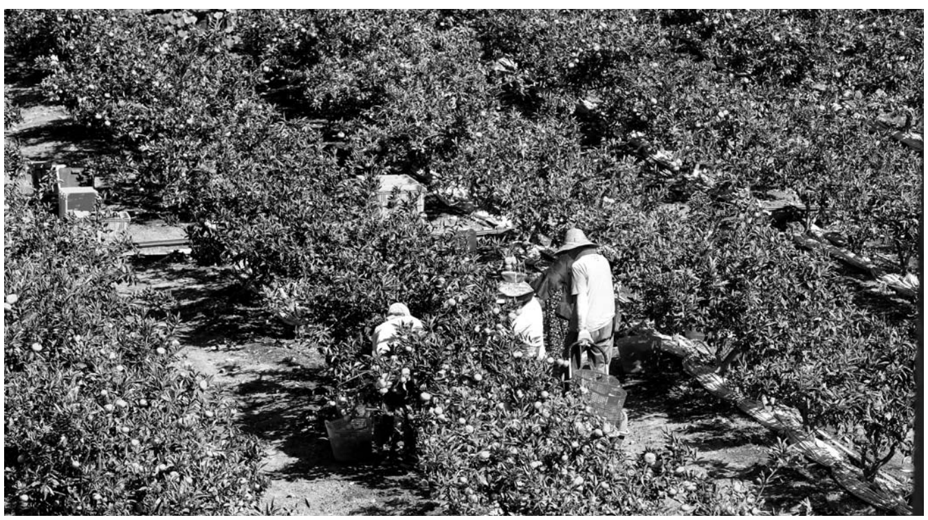
5일 오전 제주시 노형동의 한 감귤밭에서 농민들이 감귤을 수확하고 있다.

6일 호남지방통계청 제주사무소가 발표한 '9월 제주도 소비자물가동향'을 보면 도내 물가는 1년 전보다