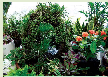
모든정원, 실내조경, 가정, 별장, 빌딩조경, 연못, 인공폭포, 잔디, 조경수 판매

꽃보라 ☎ 746-0014, H-P 010-3693-5563 (제원사거리 위 국민은행 신제주지점 맞은편 골목) 농장 제주시 용담2동 721번지