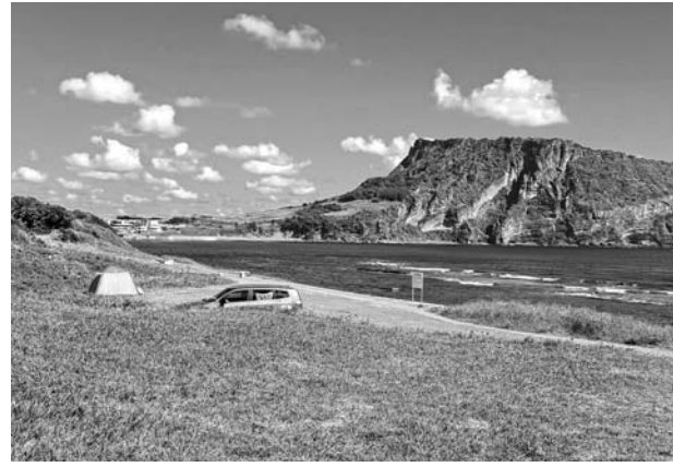
광치기 해안에서 야영 중인 텐트와 차량의 모습.

광치기 해안 주변으로는 자동차가 진입할 수 없도록 입구를 막아 놓았으나 유적지 옆에는 해안으로 차량이 진입할 수 있어 수시로 자동차가 출입하고 있다. 때문에 도로변 위로 능선을 형성했던 사