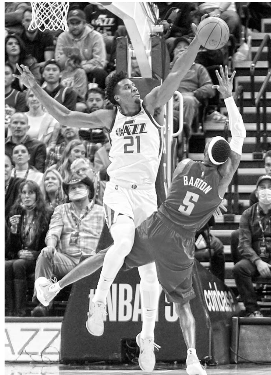
“이게 블락이아” 27일(한국 시간) 미국 유타 주 솔트레이크 시티 비비트 아래나에서 열린 2020-2021 NBA 덴버 너게츠(이하 덴버)와 유타 재츠(이하 유타)의 경기에서 유타의 하산 화이트 사이드가 블락을 하고있다. 이날 유타는 122-110으로 덴버에게 승리했다.

없고, 선수 개인 자격으로만 출전이 가능하다. 이에 따라 베이징 동계올림픽에는 출전 자격을 따낸 북한 선수들이 있으면 국가가 아닌 개인 자격으로 나올 수는 있지만, 실제 출전이 성사될지는 여전히 불투명하다. 대회 성화는 18일 고대 올림픽 발상지인 그리스 올림피아 해라 신전에서 채화돼 20일 중국 베이징에 도착했다. 성화 채화 시에 인권단체의 베이징 동계올림픽 반대 시위가 벌어졌고, 미국과 영국, 유럽 의회에서 중국 정부가 소수 민족 탄압 등 인권 상황을 개선하지 않으면 베이징 동계올림픽에 불참하거나 개최지를 변경해야 한다는 목소리가 나오고 있다.