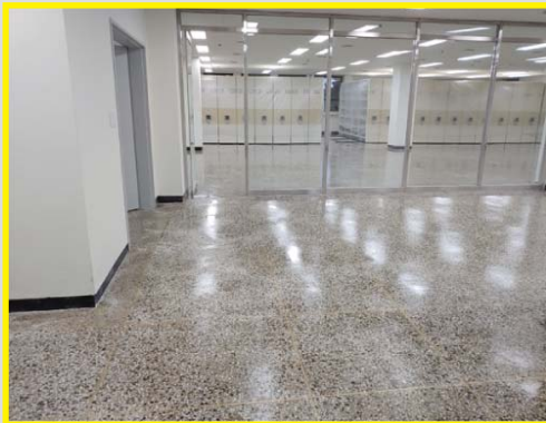
제주대 중앙도서관 도끼다시바닥