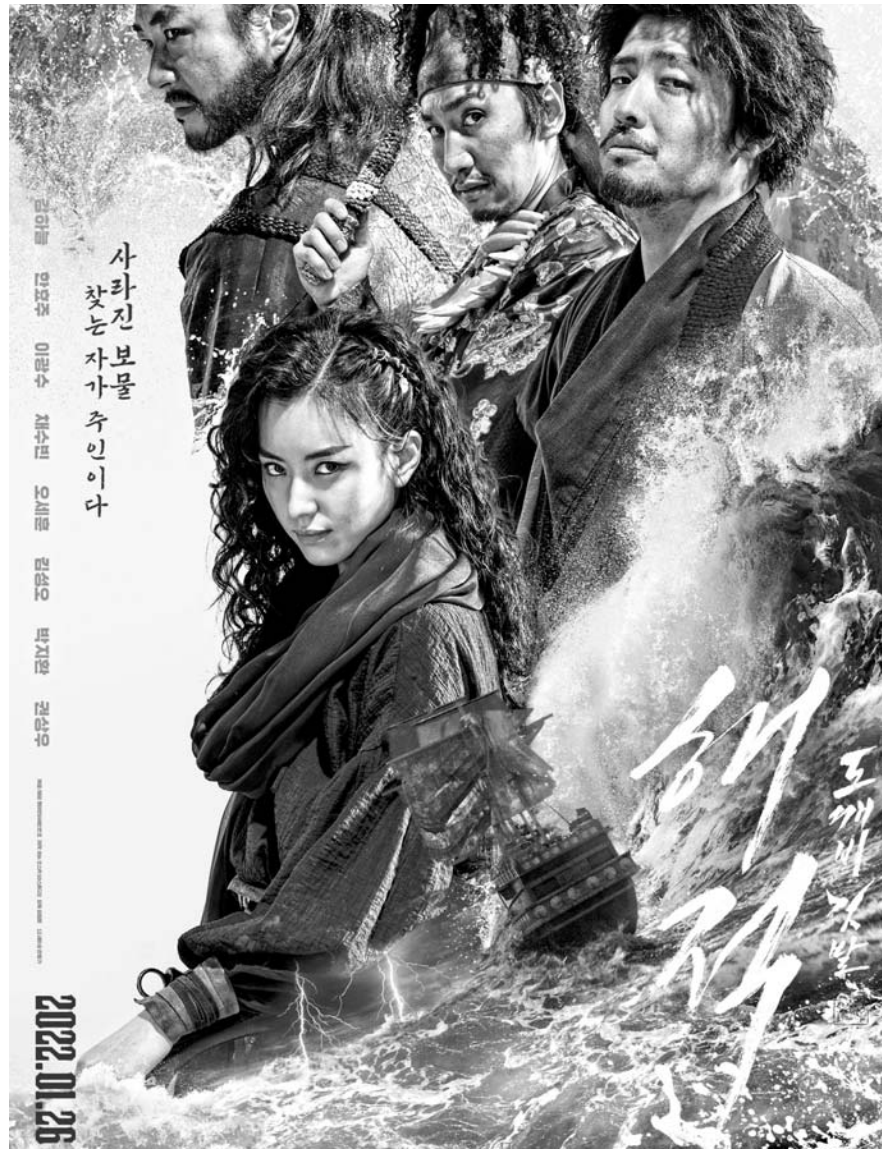
26일 개봉하는 영화 '해적:도깨비깃발'.

26일 개봉 판타지 어드벤처 영화... 볼거리 '풍성' 김정훈 감독 "CG 살아 숨 쉬게 한 건 배우들 연기"