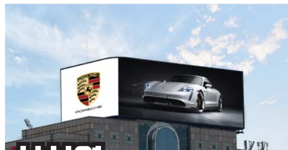
삼성역 서울시 강남구 테헤란로 626 메디톡스빌딩

24시간 교통혼잡지역 (서울, 인천지하철 환승역) 대형쇼핑몰 밀집지역 (아울렛, 마트, 시장) 퍼펙트 생활 인프라 (대형아파트, 쇼핑거리 등)