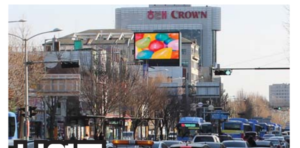
남영동 서울 용산구 남영동 88-8 남영빌딩

청계천, 각종 상가 및 시장 밀집지역 강남, 강북, 강동, 강서 각각 4방위로 갈 수 있는 교통의 출발지로서의 능률적 광고효과