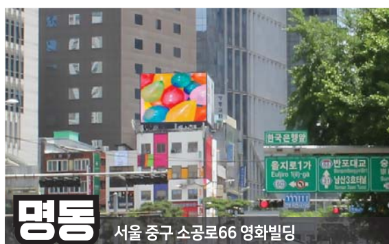
명동 서울 중구 소공로66 영화빌딩

한남대교 남단에서 강남대로 방향 노출 (차량유동이 매우 많은 상습정체 구역)