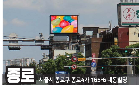
종로 서울시 종로구 종로4가 165-6 대동빌딩

서울의 관문중의 하나인 김포공항 앞에 위치 관광객 및 쇼핑센터 이용객 등 강서지역의 최대 유동인구밀집