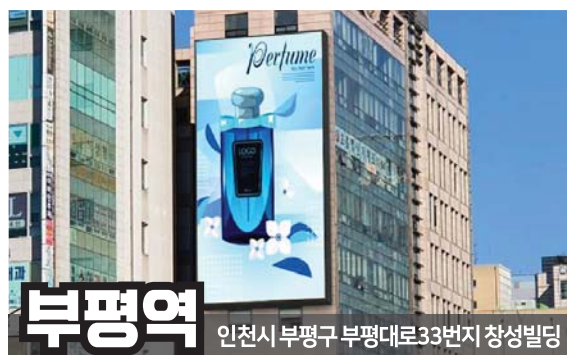
부평역 인천시 부평구 부평대로33번지 창성빌딩

24시간 교통혼잡지역 (서울, 인천지하철 환승역) 대형쇼핑몰 밀집지역 (아울렛, 마트, 시장) 퍼펙트 생활 인프라 (대형아파트, 쇼핑거리 등)