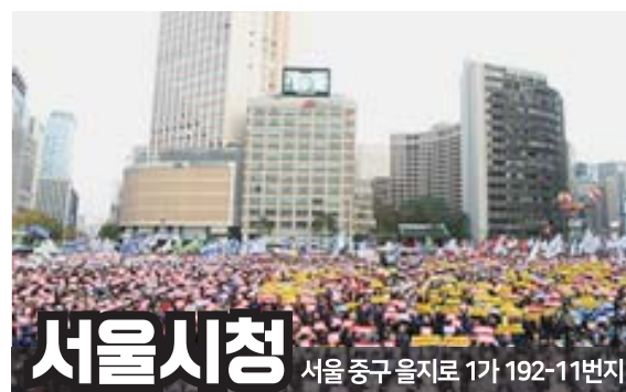
서울시청 서울 중구 을지로 1가 192-11번지

일반도로와 고속도로에서 동시 노출되는 국내 유일 미디어 출퇴근 시간대 차량 정체 극심 4개 차선 PLUS 유동량 UP