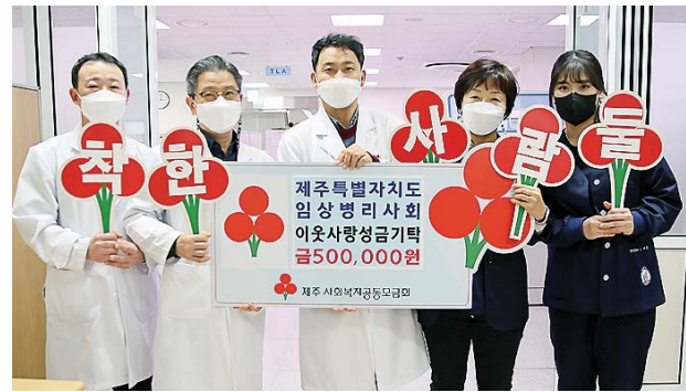
제주특별자치도 임상병리사회 관계자들이 지난 12일 이웃 돕기 성금을 기탁하고 기념촬영을 하고 있다.

지난 2019년부터 시작된 코로나19와 관련해 병원 내 코로나 검사뿐만 아니라 제주지역 보건소를