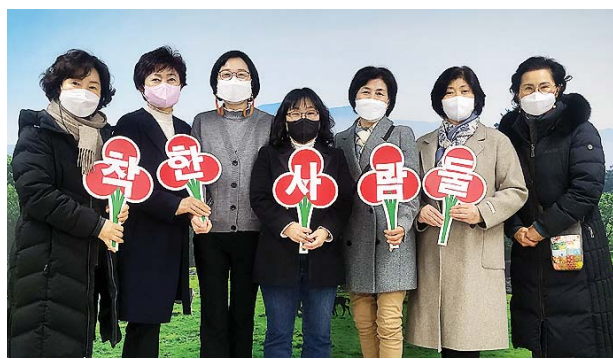
아라동 아라아이파크부녀회는 회원들의 자발적인 참여로 매년 꾸준한 이웃 돕기 활동을 펼쳐나가고 있다.

누군가는 도시의 아파트가 삭막하다고 말하지만 이웃과 함께 또 다른 이웃을 향해 따뜻한 온기를 전하는 착한 사람들이 있다. 한리일보와 제주사랑의열매가 공동기획하는 착한 사람들 네 번째 주인공은 아라아이파크부녀회이다.