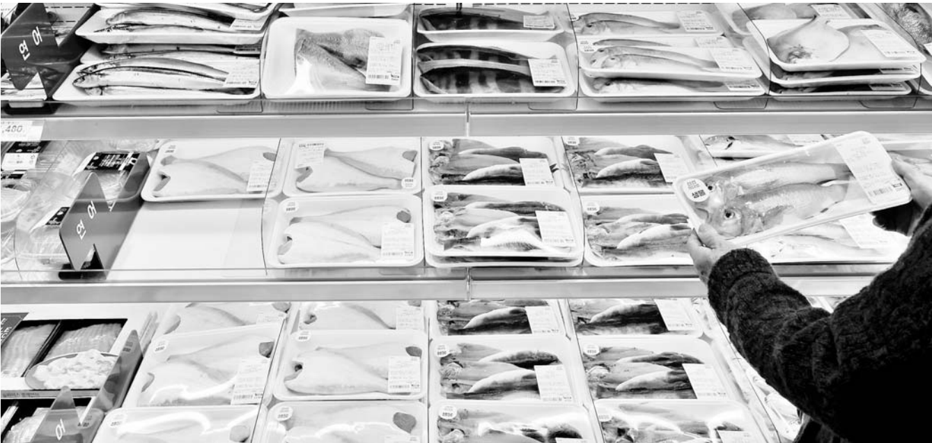
수산대전 특별전 개최 9일 서울 용산구 이마트 용산점에서 한 시민이 수산물을 살펴보고 있다. 해양수산부는 소비자 제감 물기를 인화하기 위해 이날부터 26일까지 '대한민국 수산대전-2월 감쪽특별전'을 개최한다. 이마트, 롯데마트, 홈플러스 등 14개 오프라인 업체와 우체국쇼핑, 마켓컬리, 쿠팡 등 26개 온라인 쇼핑몰이 참여한다.

또 원물 중심의 농축산물 유통에서 벗어나 가공식품 공급까지 확대해 판매사업을 증대할 예정이다. 금융 부문에서는 최근 고금리·고물가·고환율 등으로 어려움을 겪는 농업인과 중소기업·영세 자영업자 등을 대상으로 금융취약계층 지원을 강화한다. 2월 1일부터 1년동안 취약자주의 대출상환에 따른 수수료 부담 완화를 위해 중도상환수료를 전액 면제기로 했다. 또 중소기업·소상공인의 자금난 해소와 경영안정 도모를 위해 지역 신용보증재단과 함께 신규자금을 지원할 예정이다. 고향사랑기부제 시행에 맞춰 출시한 NH고향사랑기부예·적금 판매액에 따라 조성된 공익기금(판매액의 최대 0.1%)은 농업·농촌과 지역사회를 위해 활용된다. 문미숙기자