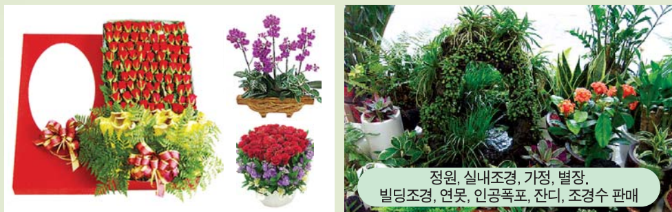
정원, 실내조경, 기증, 별장, 빌딩조경, 연못, 인공폭포, 잔디, 조경수 판매

동·서양난, 축하근조 꽃바구니, 각종 관엽식물, 꽃다발, 플라워박스, 꽃의 모든것