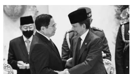
브루나이를 방문해 하사날 불키아 국왕과 만난 팜 민 쯤 베트남 총리.

베트남과 브루나이가 디지털 경제 구현과 기후변화 대응을 위해 공조하기로 했다.