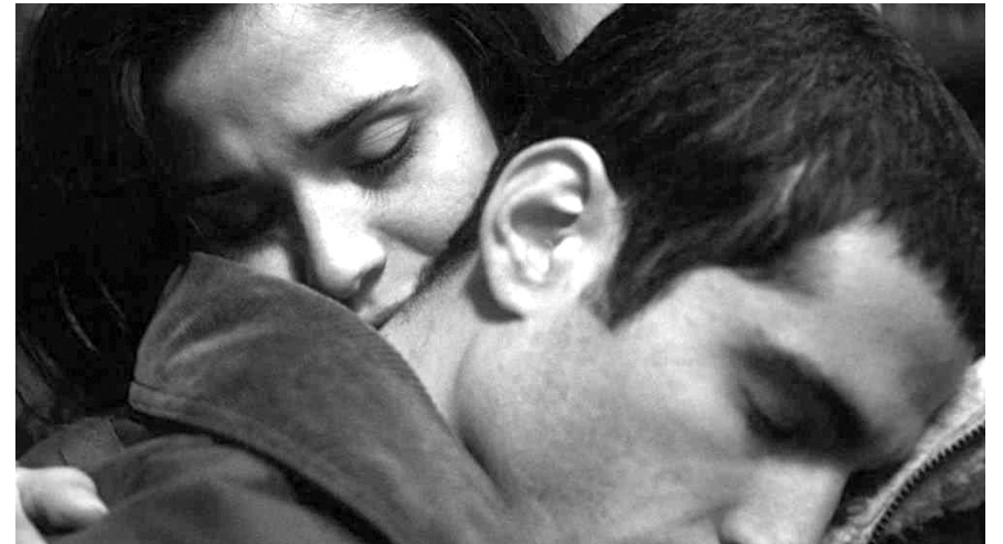
영화 '나의 연인에게'.