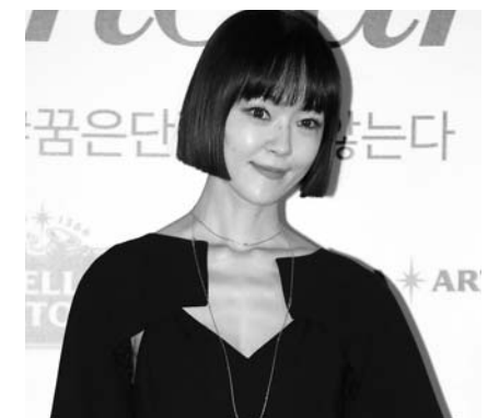
많은 팬들에게 반가운 선물이 될 것"이라고 전했다.