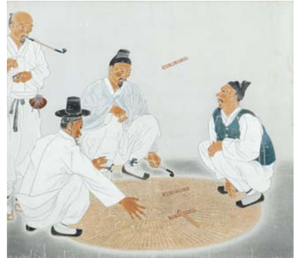
백윤문 작 '근근일학' (은양민속박물관 소장)

한국 근현대 역사 속에서 슬한 굴곡의 과정을 겪으며 변화해온 동양화의 과거와 현재를 한자리에서 살펴볼 수 있는 전시가 마련됐다. 제주도립미술관이 지난 5일부터 미술관 전관(기획전시실, 시민갤러리)에서 선보이고 있는 '무릉도원보다 지금 삶이 더 다정하다' 전이다.