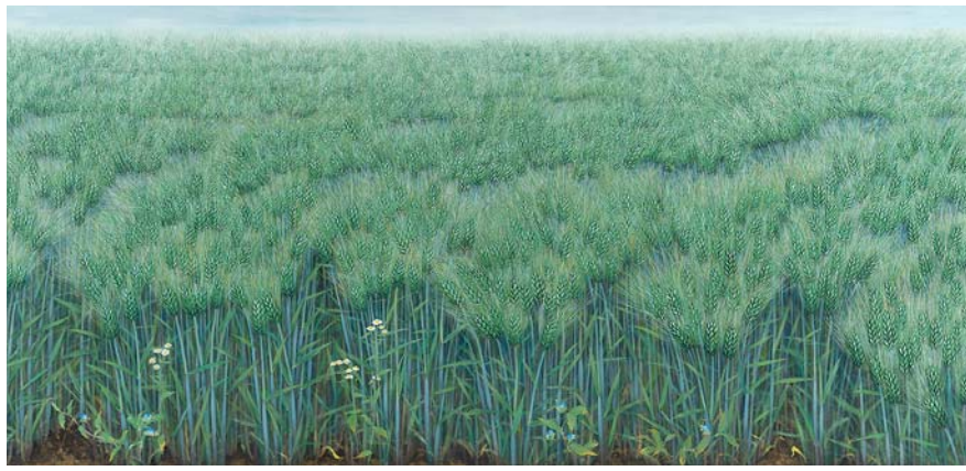
이숙자 작 '망초꽃이 있는 청막'

두 번째 섹션 '권(券) 2'에선 1960년부터 2000년까지의 시기를 다룬다. 산수화에서 과감히 벗어나 동양화의 재료와 조형성을 재탐구