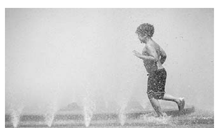
미국 서북부 폭염.

미국과 유럽, 아시아 등 세계 곳곳에서 때 이른 폭염으로 역대 최고 기온을 경신하는 등 이상고온 현상이 이어지고 있다.