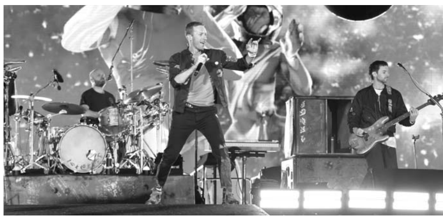
록밴드 월드컵플레이.

노벨 사무총장은 "그들이 이곳에서 공연하는 것을 놔두는 것은 성소수자·무신론자 운동을 지지하