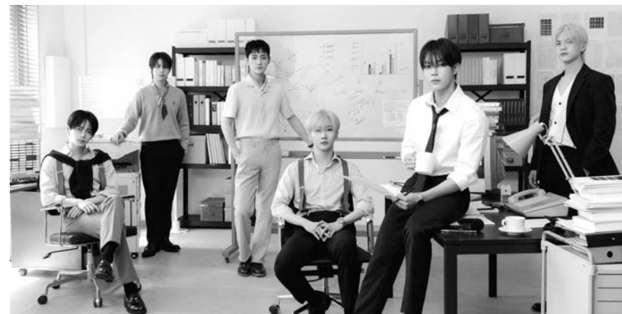
그림 베리베리.

제니는 22일 시사회와 레드카펫 등 칸영화제 공식 일정을 소화할 예정이다.