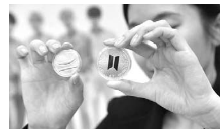
BTS 데뷔 10주년 기념 1차 메달. 연합뉴스

특히 1000장 한정 수량으로 제작된 금메달 1온스 제품은 커머스 플랫폼 위버스샵을 통해 오픈한 지