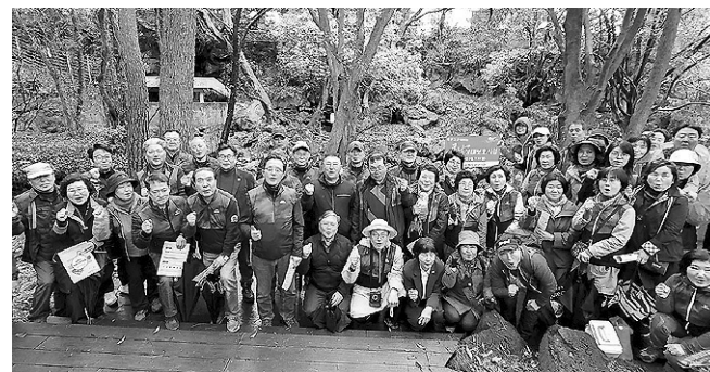
코드 제작 부착, 큰낭 후계목 생육공간을 확보, 주변 환경정비, 필요 시 냉물제거 및 등 큰낭생태보호 활동 등을 펼치게 된다.

봉사단은 11월까지 제주생명의숲에서 발간한 큰낭 이야기에 수록된 도내 노거수 73그루에 대해 큰낭의 생육 및 병해충 상태를 모니터링 기록하고, 큰낭 QR