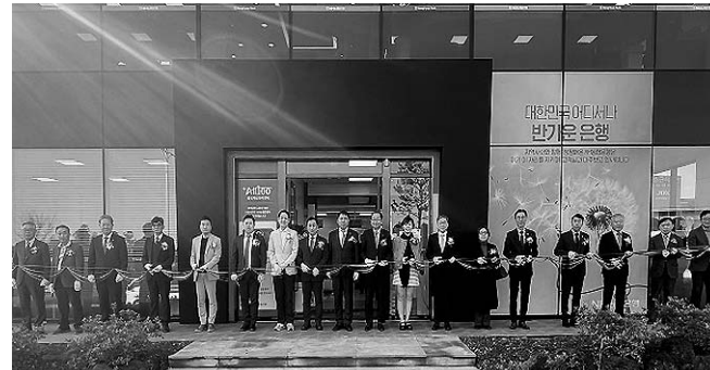
께 지역사회발전을 지원하는 기부금 전달식도 진행됐다.