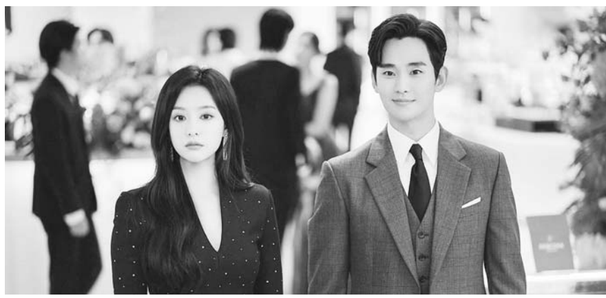
드라마 ‘눈물의 여왕’