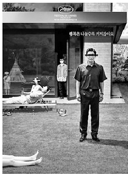
한국을 대표하는 메가 히트작 ‘기생충’과 ‘오징어게임’

다만 선호하는 한국 드라마와 영화는 3~5년 전 히트작에 머물러 있었다. ‘오징어 게임’이 3년 연속 가장 좋아하는 한국 드라마로 꼽혔고, 가장 선호하는 한국 영화 1위와 2위로는 ‘기생충’과 ‘부산행’이 각각 5년 연속 선정됐다.