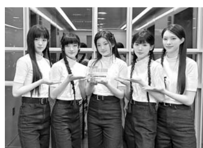
신인 걸그룹 ‘아일릿’