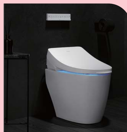
살균비데 프리미엄 BD-H910HB