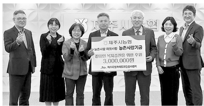
제주시농협 농촌사랑기금 기탁

농촌사랑기금은 농업·농촌의 복지 향상 등 공익목적으로 조성되는 기금이다.