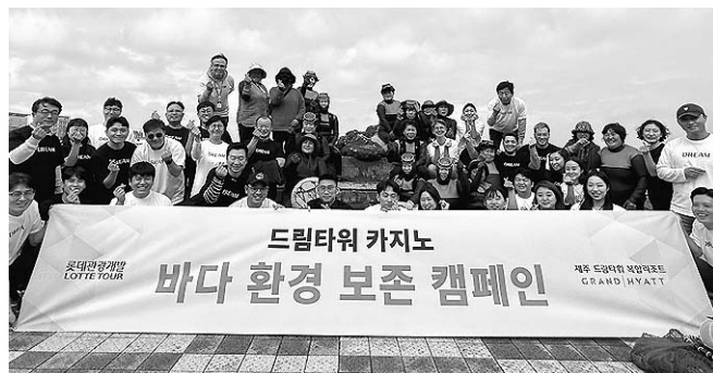
드림타워 카지노 바다 환경 보전 캠페인

제주 드림타워 복합리조트는 친수용수 방류에 따라 도두동 출천 환경 정화 캠페인을 매년 진행하고 있다