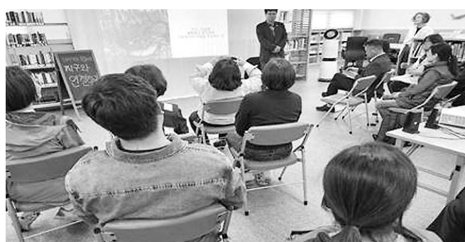
새마을문고조천읍분회 북 콘서트

이날 북 콘서트는 문화공동체 생활 및 독서문화 활성화 방안과 기후위기를 함께 고민해 보고자 마련됐다.