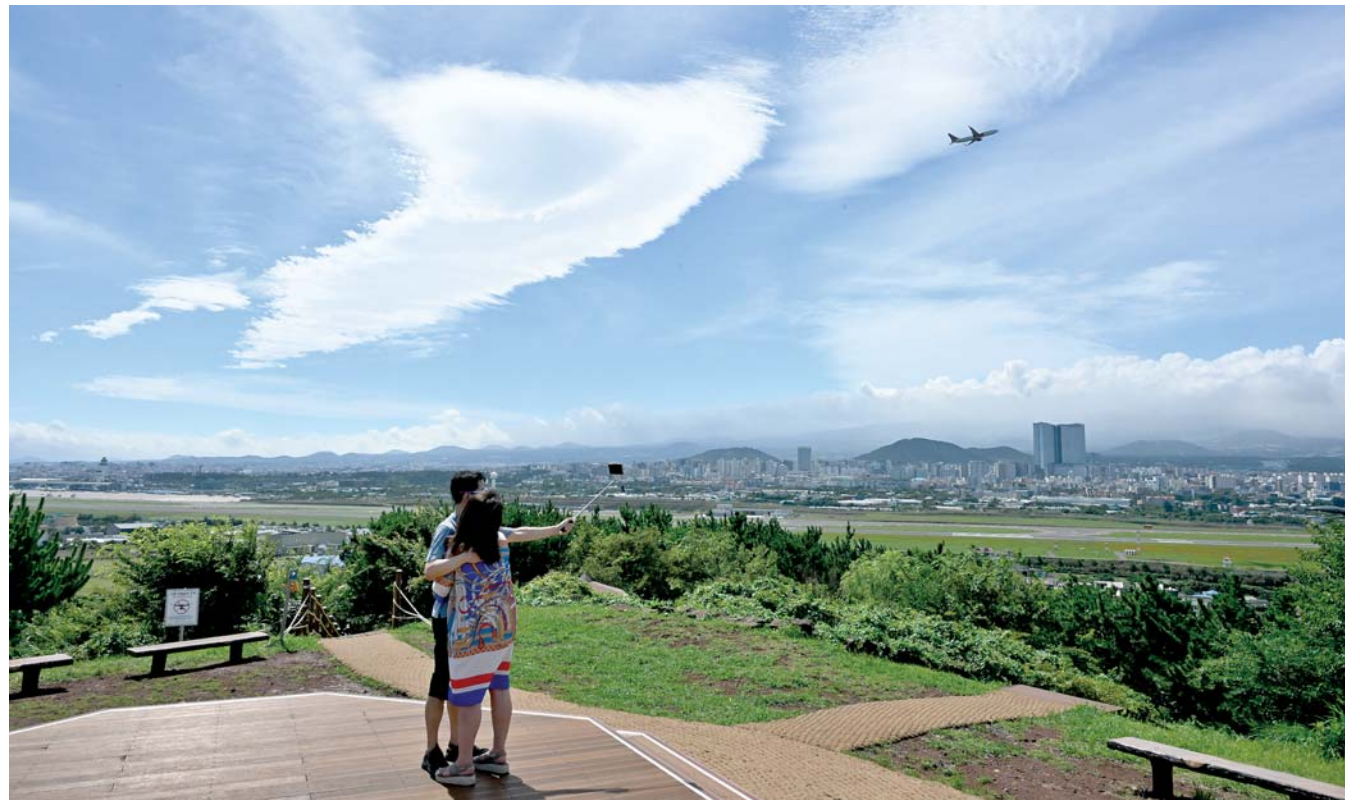
“아, 같이가”… 비행기 쫓는 구름비행기 정제전선이 잠시 물러간 2일 제주시 도두봉 상공 파란하늘 아래 비행기 모양의 구름과 이륙하는 비행기가 묘한 장관을 연출하고 있다.

불안감(17.6%), 결혼·출산 연령의 증가(7.9%) 등에 대한 답변도 적지 않았다. 또한 정부나 제주도의 저출산 문제에 대한 정책 평가와 관련, 부정적(48.6%) 입장이 강했고 긍정적이라는 응답은 6.5%에 불과했다. 저출산 해결에 도움이 될 만한 정책에 관한 질문에 응답자 대부분은 자녀가 있는 가정에 다양한 할인혜택 제공(45.3%)과 남녀가 동등하게 탄력 근무제를 사용할 수 있는 환경(40.9%)을 원했다. 미혼인 응답자도 남녀가 동등하게 탄력 근무제를 사용할 수 있는 환경과 경력 단절 해소 등 육아친화적 문화 조성에 많은 관심을 보였다. 제주지역 여건에서 이상적인 자녀수는 20대와 30대는 1명이라는 응답이 많았고, 나이가 많을수록 2명이라고 답했다. 어떠한 조건을 줬을 때 아이를 낳겠느냐는 복수 질문에는 경제적 부담에 따른 충분한 급여 제공(47.9%)과 아이를 믿고 맡길 수 있는 공공기관 및 전문가 확대(46.9%)로 나타났다. 특히 미혼은 충분한 급여(65.1%)를 가장 많이 선택했다. 백금타자 haru@ihalla.com