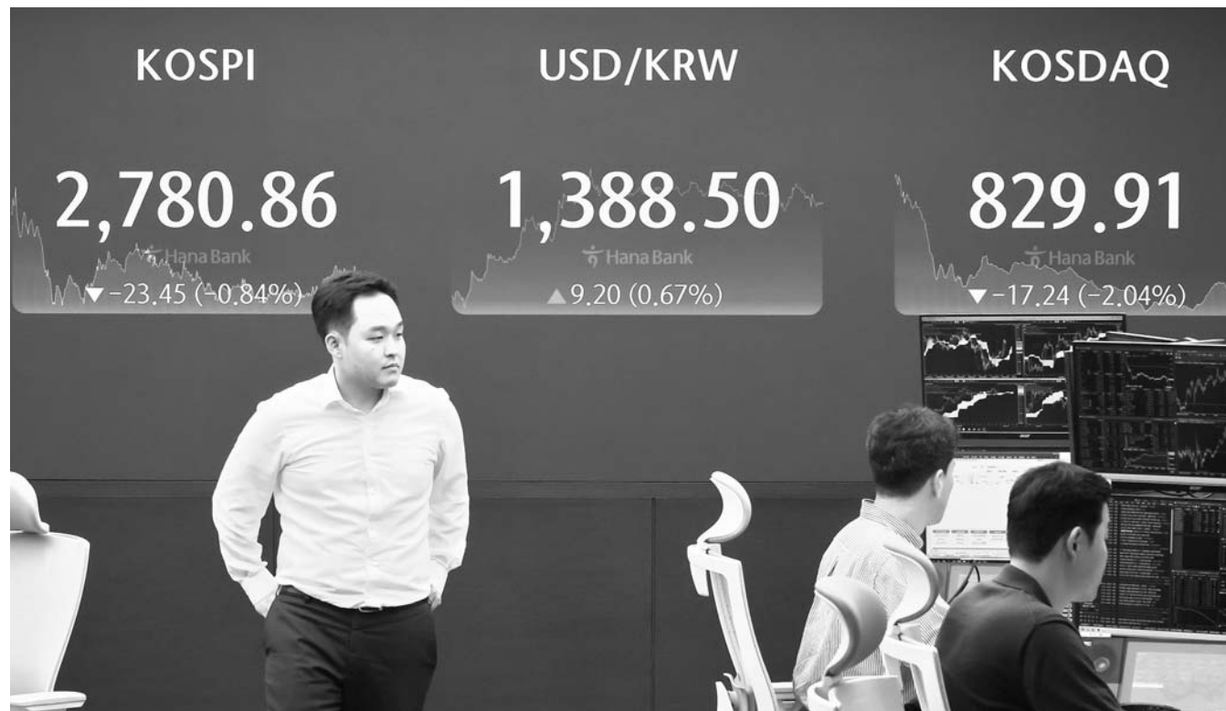
코스피, 0.8% 하락해 2800선 내줘 2일 코스피는 전거래일보다 23.45포인트(0.84%) 내린 2,780.86에 장을 마쳤다. 코스닥은 17.24포인트(2.04%) 내린 829.91에 마감했다. 사진은 이날 서울 중구 하나은행 본점 딜링룸.

제주특별자치도가 도내 양식 어업인들의 경영난 해소를 위해 양식장 자동화장비 보급 지원을 확대한다. 이는 최근 양식장 전기요금과 사료 가격 인상으로 인한 양식 어업인들의 경비 부담을 덜어주기 위한 조치다. 도는 올해 본예산 7억6500만원을 투입해 양식장 38개소를 지원했고, 1회 추가경정예산을 통해 2억원을 확보해 14개소에 추가 지원할 예정이라고 2일 밝혔다. 추가 지원 대상은 지난 2월 1차 사업자 선정 시 예산 부족으로 우선순위 기준에 따라 예비순위로 선정된 양식장들이며, 지원액은 어가별로 신청한 금액 전액이다. 주요 지원 품목은 고효율 해수펌프, 사료혼합기, 전동지게차 등이며