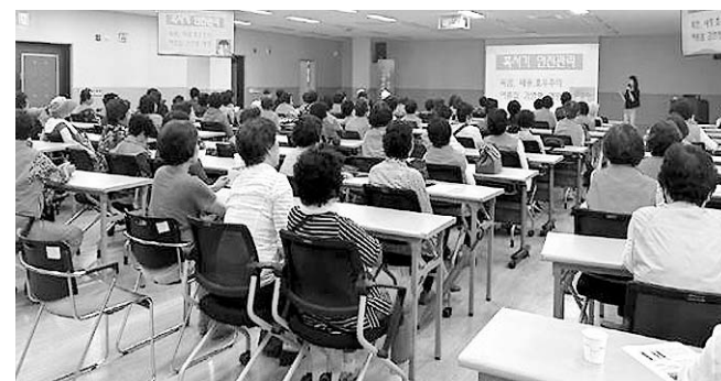
서귀포시니어클럽 노인일자리 안전교육

이날 회원들은 멸치볶음, 장아찌 등 4가지 반찬을 직접 만들어 관내 고령·취약농가 60여 가구를 방문해 전달하며 온정을 나눴다.