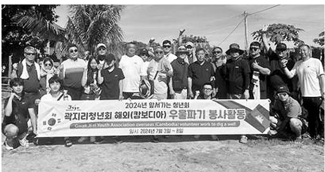
곽지리청년회 캄보디아 오지마을 봉사