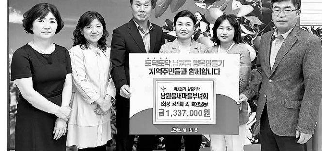
남원읍부녀회 이웃돕기 성금 기탁