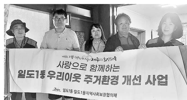
일도1동 취약계층 주거 환경 개선

국제와이즈멘 최남단클럽(회장 김중필)은 지난 10일 서귀포시 안덕면(면장 오승언)을 방문해 어려운 이웃에게 전달해 달라며 쌀 180kg을 기탁했다. 최남단클럽은 대정읍에도 사랑의 쌀 15포(150kg)를 기탁했다.