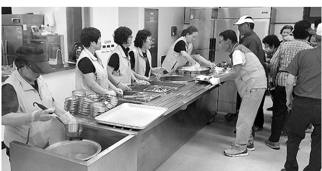
한국부인회 대정분회 경로식당 봉사

(주)웅진엔지니어링은 창립 18주년 행사를 통해 임직원 화합은 물론 엔지니어링 서비스업의 위상을 높이기로 다짐했다.