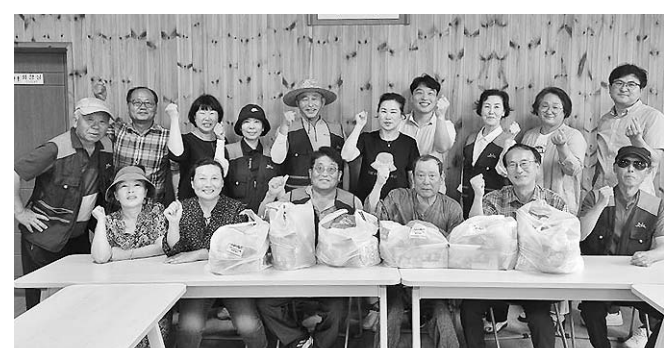
봉개동 행복한 나눔 푸드 사업