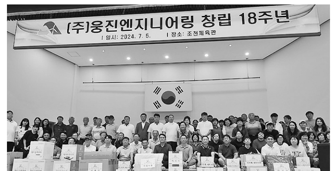
웅진엔지니어링 창립 18주년 기념식

이번 교육에서는 폭염·태풍·호우 대비행동 요령, 여름철 감염병 예방, 식중독 예방법 등을 안내했다.