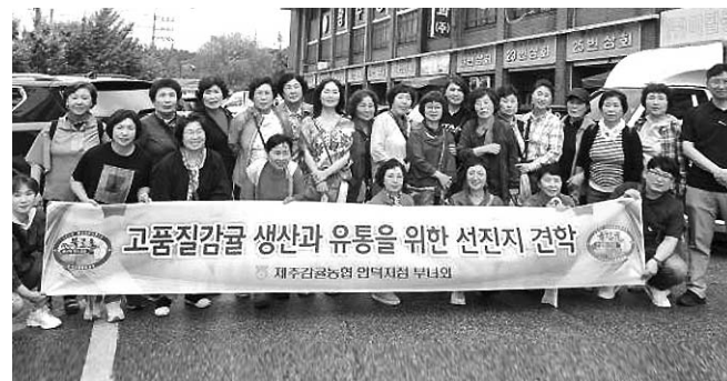
감골농협 안덕부녀회 도내 선진지 견학

이번 행사는 제주남원농협과 청송농협의 자매결연 26주년을 맞아 유대 강화를 위해 마련됐으며, 청송농협은 제주도에 1000만원을, 제주남원농협은 청송군에 1000만원을 기부했다.