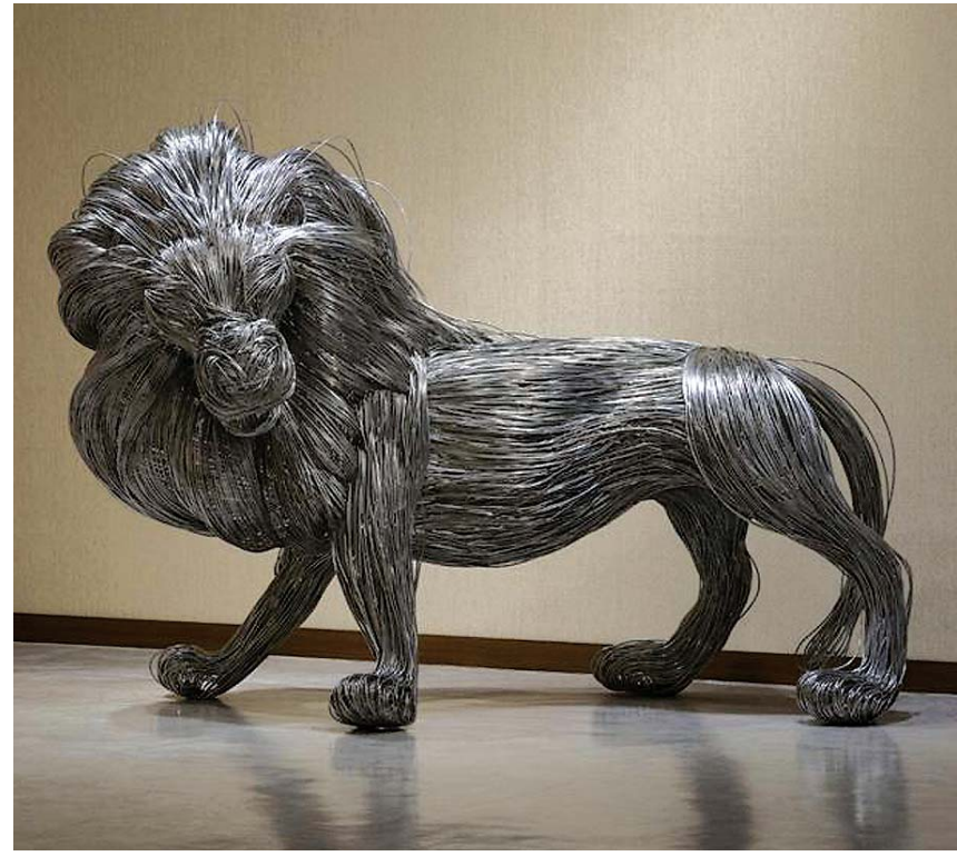
제50회 제주미술대전 대상 수상작 김다슬의 '운유하게'

김순관 미술대전 2차 심사위원장은 심사평에서 "다루기 힘든 재료를 활용해 공간과 조형의 기본