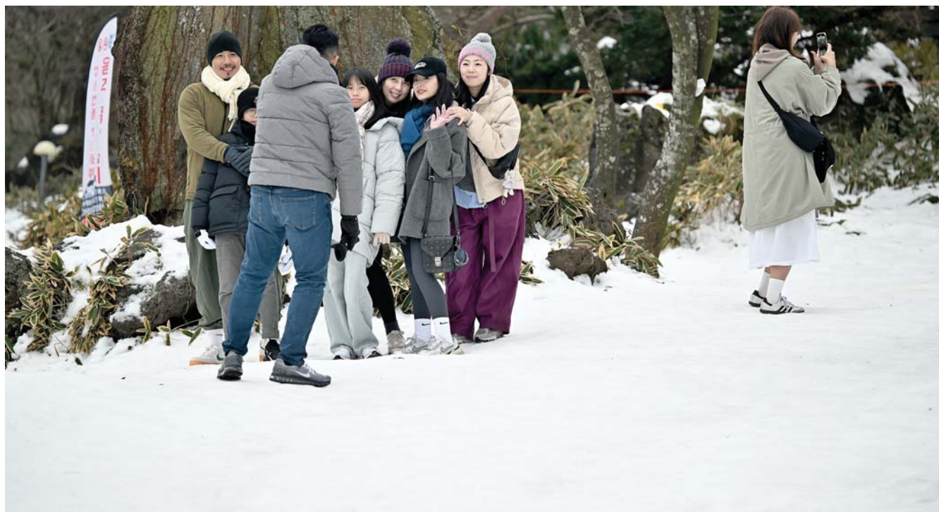
겨울왕국으로 변신한 1100고지 1일 눈쌓인 한라산 1100고지를 찾은 관광객들이 사진을 찍으며 즐거운 시간을 보내고 있다.

제주시는 “실태 조사를 토대로 마을만들기 시설물의 유효화 방지와 활성화에 지원을 아끼지 않겠다”고 했다. 전선희기자 sunny@ihalla.com