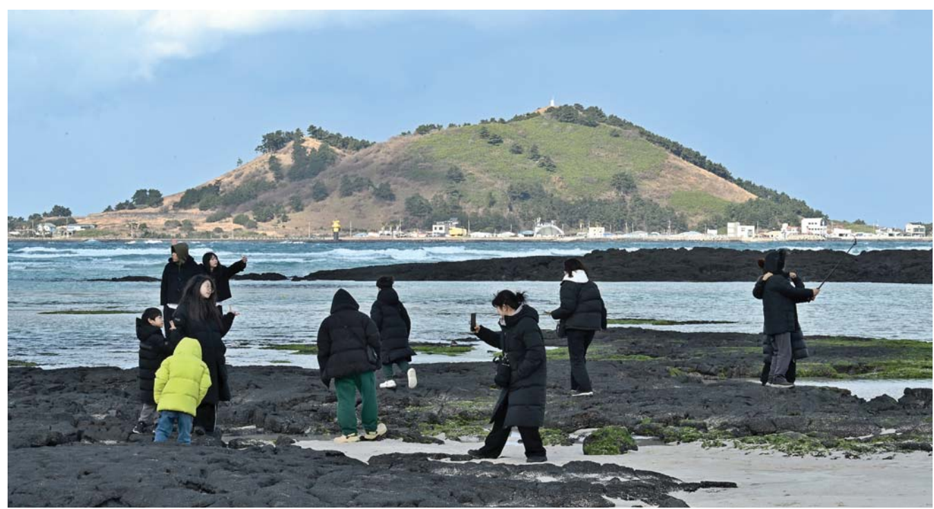
겨울 해수욕장 풍경 7일 제주시 한림읍 금릉해수욕장을 찾은 관광객들이 천년의 섬 비양도를 배경으로 사진을 찍고 있다.

한편 찬 공기가 남하하는 영향으로 8일 아침 최저기온은 3~7도에 머물고 9일에는 기온이 떨어져 이날 아침 최저기온은 0~2도에 그칠 전망이다. 이상민기자