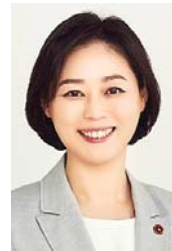
이승아 제주특별자치도의회 환경도시위원회 의원

그렇다면 왜 제주에서 이런 위기가 반복되는가. 제주는 아름답지만 고립되기 쉬운 섬이다. 읍·면 지역 고령층은 의료 접근성과 대화 상대가 부족하고, 중장년층은 생계 부담과 불안정한 일자리 속에서 도움을 청하기 어렵다. 정신건강 서비스를 이용하고 싶어도 기관과 인력은 충분하지 않으며, 상담이나 치료 자체를 주저하게 만