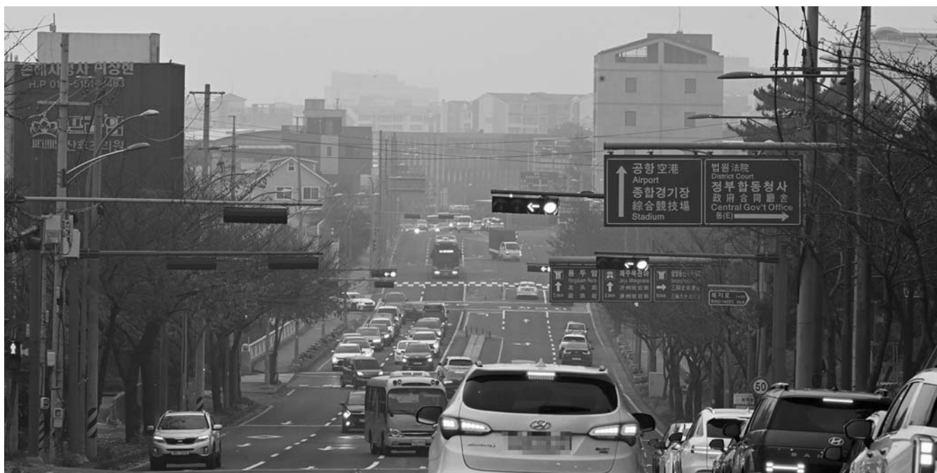
따뜻했지만… 미세먼지 ‘나쁨’ 1일 미세먼지 농도 ‘나쁨’을 보인 제주시 오라동 시가지가 뿌옇게 보인다.