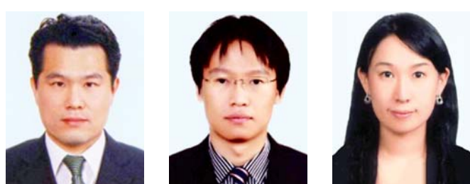
홍순욱 수석부장판사 서인덕 부장판사 김희진 부장판사

은 사건 기록을 꼼꼼하게 검토해 소송지휘권을 적절히 행사하는 등 절차를 신속하게 진행하고, 법정에서 사건관계인에게 친절하게 소명의 기회를 충분히 보장하는 등 공평하고 합리적인 재판 진행으로 당사자들이 승복할 수 있는 판결을 내린다는 평가를 받았다.