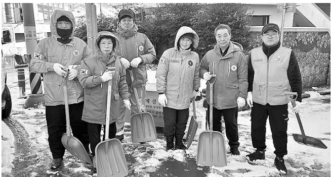
중앙동지역자율방재단 긴급 제설작업

제주사회복지공동모금회(회장 강지연)는 지난 12일 제주아스타호텔에서 '2026년 제1차 아너 소사이어티 클럽 총회'를 개최하고 도내 나눔문화 활성화를 위한 의견을 공유하는 시간을 가졌다. 총회에서는 2026년 사업 계획 및 예산, 클럽 회칙 개정 등을 논의했다. 아너 소사이어티는 공동모금회가 만든 개인 교액 기부자 모임으로 2007년 12월 설립됐다.