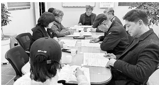
효돈동주민자치회 1월 임원회의 개최

제주시 삼도1동(동장 송정심)은 지난 1월 12일부터 시작되는 2026년 노인일자리사업 참여자 11명을 대상으로 안전교육을 실시했다. 이번 교육은 동절기 한파를 대비한 노인일자리사업 참여자의 안전의식 고취 및 안전사고를 예방하기 위해 실시됐다.