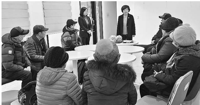
삼도1동 노인일자리사업 참여자 안전교육

서귀포시 예래동(동장 김달은)은 지난 12일 노인일자리 사업 참여자를 대상으로 중대재해 예방과 안전한 근무환경 조성을 위한 산업안전보건교육을 실시했다. 교육은 작업 중 발생할 수 있는 안전사고 예방 수칙과 중대재해 예방을 위한 기본 안전수칙, 작업 전 점검사항 등을 중심으로 진행했다.