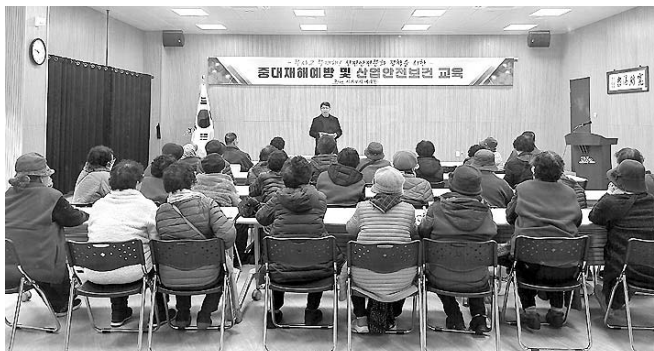
예래동 노인일자리 참여자 교육