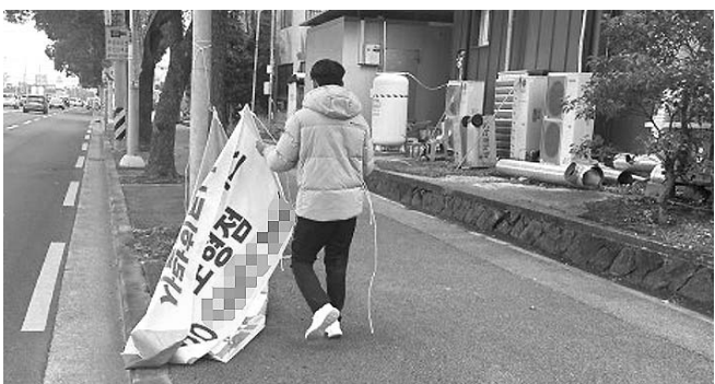
노형동 주요 도로변 불법광고물 정비