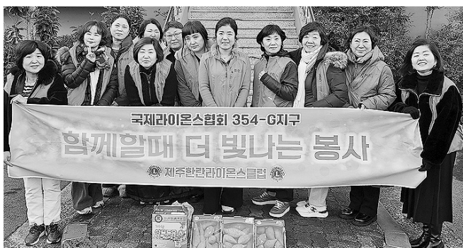
한란라이온스클럽 노인 1인가구 청소봉사