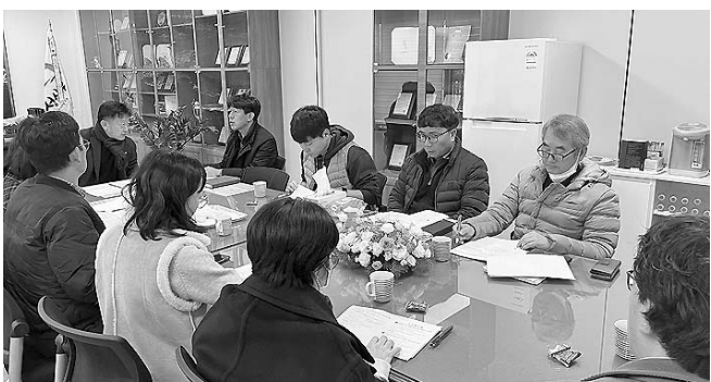
성산읍 직원 주간 업무회의 개최