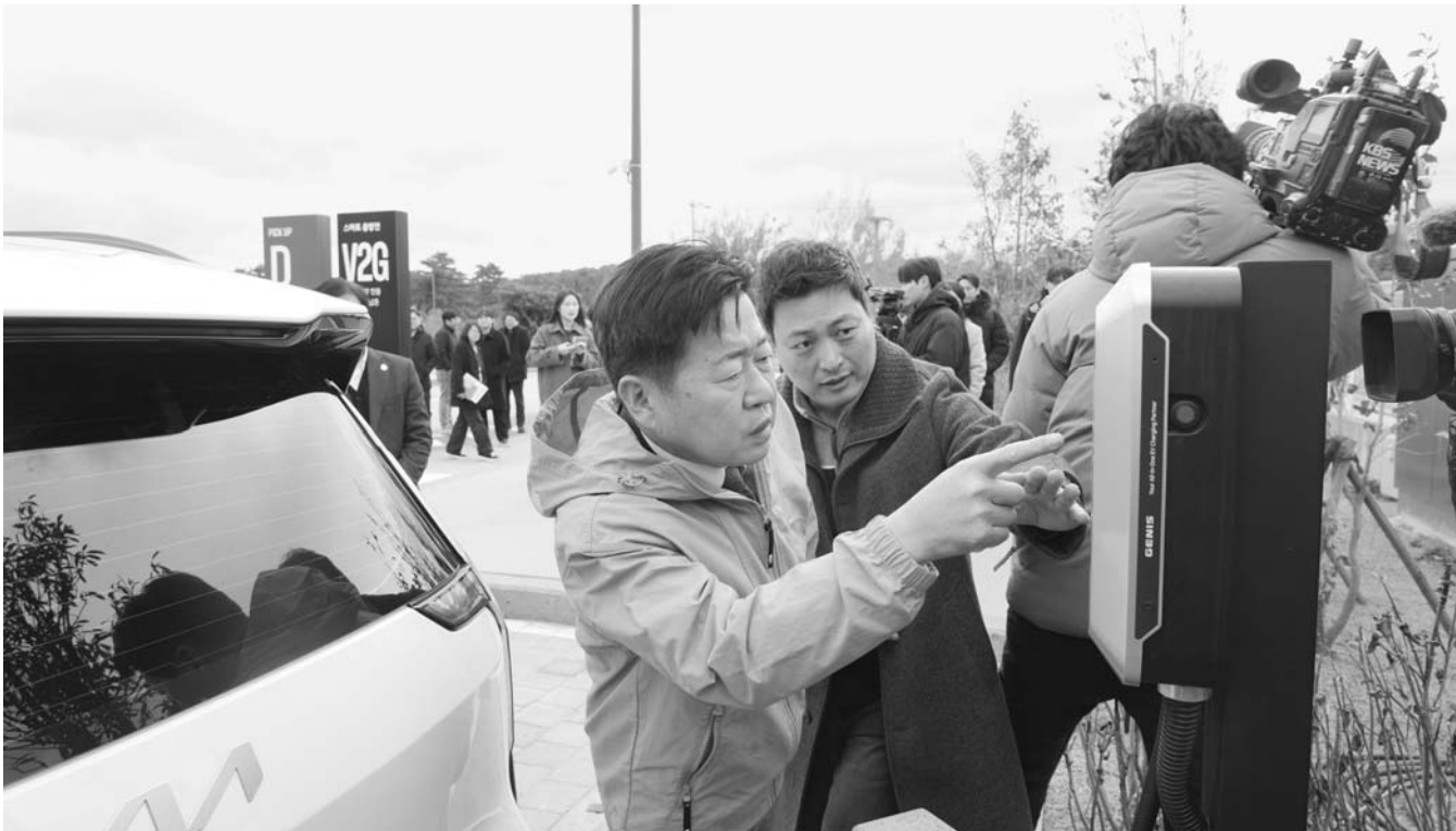
오영훈 지사가 20일 V2G 시범 사업 현장을 찾아 주요 설비를 둘러보고 있다.