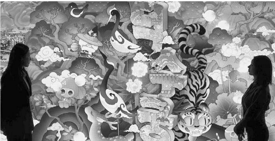
서울 덕수궁 돈덕전에서 열린 '제2회 국가유산의 날' 기념 특별전 '쿠키런: 사라진 국가유산을 찾아서' 언론공개회에서 관계자가 전시물을 살펴보고 있다.

전통예술과 점점 늘리는 추세 게임 속 캐릭터 세계관 재해석 사라진 국가유산을 찾아서