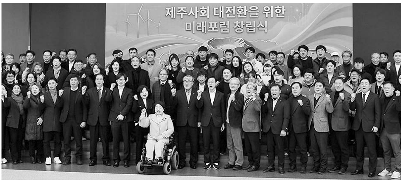
제주사회 대전환을 위한 미래포럼이 지난 7일 제주시농협 오라점 대회의실에서 창립식을 개최했다.